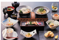
べっぴんハモ会席