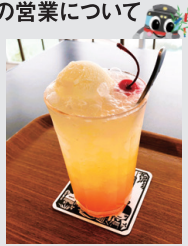
須磨浦山上遊園「喫茶コスモス」

観光リフト・サイクルモノレール、ミニカーランドの営業は、7月18日(金)までは土・日のみ営業します。 7月19日(土)～8月31日(日)の土・日・祝および8月12日(火：臨時営業)～15日(金)は18:00まで営業時間を延長します。