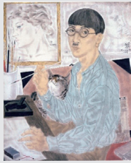
藤田嗣治《自画像》1929年 東京国立近代美術館 © Fondation Foujita/ADAGP, Paris & JASPAR, Tokyo, 2025 E5974

同時代を生きた二人の巨匠・藤田嗣治と国吉康雄が、ともにパリに滞在した1925年から百年目になることを機とした特別展。全9章での構成となり、藤田嗣治の《自画像》など東京国立近代美術館からの出品をはじめ、油彩画を中心に約120点、直筆の書簡などの資料も多数。本展は、巡回無し、兵庫県立美術館のみの開催。