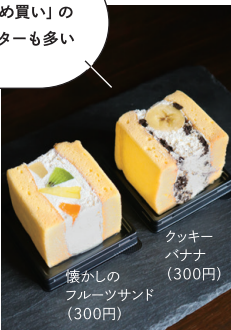
クッキー バナナ (300円)