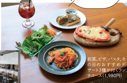
前菜、ピザ、パスタ、その日のおすすめデザート3種が付くランチコース(1,980円)

(上) オリーブとまと(220円) (下) クリームパン(180円) (右) リンゴデニッシュ(230円)