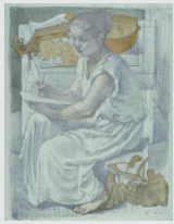
小磯良平《描く婦人》1955年 リトグラフ 紙 神戸市立小磯記念美術館蔵

版画に関心を持っていた小磯良平は戦後、東京藝術大学で教鞭をとり、版画教室の開設に尽力。本展では、小磯良平による銅版画と石版画の代表作と、指導者や版画研究室の教え子たちの作品110点と資料を紹介する。