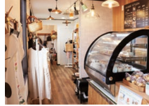
DIYした温かみのある店内