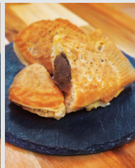
コーヒーあんたい焼 (220円)

山陽電車がオフィシャルスポンサーとして活動を支援している「神戸須磨シーワールド」の入館券とオルカくじ参加券をプレゼント！ 詳細は右上のプレゼント欄をCHECK。