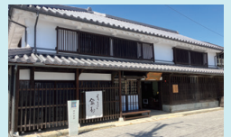
工業松右衛門旧宅