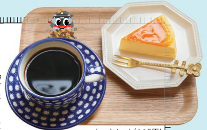
ケーキセット(660円) (ケーキ、ドリンクは 何を選んでも同価格)