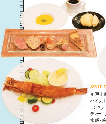
Chat-Colza ごほうびランチコース (エビフライ) (3,520円)

神戸市垂水区坂上4-2-29 ハイツ川口1階 ランチ/11:00~15:00(L.O.14:00) ディナー/17:30~22:00(L.O.20:00) 水曜・第4火曜定休 ☎078-798-5079 Instagram (@chatcolza) ◆「東垂水駅」から徒歩約8分