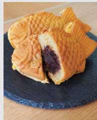
あんバターたい焼 (220円)

販売店舗：山陽たい焼明石店（「山陽明石駅」徒歩すぐ） 販売時間：10:00～20:30（日・祝～20:00）