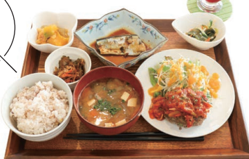
ハンバーグに煮魚、小鉢二品と味噌汁が付いた 気まぐれランチドリンクセット(1,200円)

神戸市垂水区中道2-2-14 9:00~17:00 日曜定休 ☎078-203-1805 Instagram (@cafefaithmama) ◆「東垂水駅」から徒歩約4分