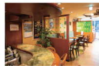
落ち着いた雰囲気と奥行きのある店内