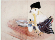
筑前化物絵巻 酒盗鳥 個人蔵 鞆手町歴史民俗博物館寄託

現在はキャラクター化され、人気を博している日本の妖怪だが、人間を超えた力を持つ自然の恐ろしさを具現化したものとして、長らく畏れの対象となっていた。また、妖怪と実在の生物の間を揺れ動く「幻獣」も畏れの感覚を呼び覚ますもの。本展では、妖怪や幻獣とおとて、日本人と自然環境とのかかわりについて考える。