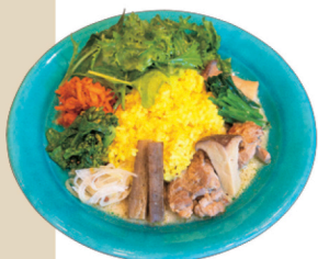
野菜ゴロゴロおとなの甘辛グリーンカレー (1,320円)

姫路市忍町106 ① 11:30-14:30 (ランチ L.O.13:30) ※売り切れ次第終了 (ドリンク L.O.14:00) ※テイクアウトドリンクのみ 10:00～14:00 ② 木曜、日曜 ☎ 問い合わせ・営業時間などについては Instagramから 📍「山陽姫路駅」徒歩約5分 Instagram (@hitsujiigumo106)