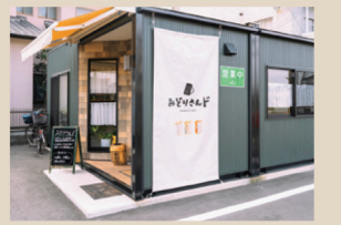
タバストリーが目印のコンテナハウス