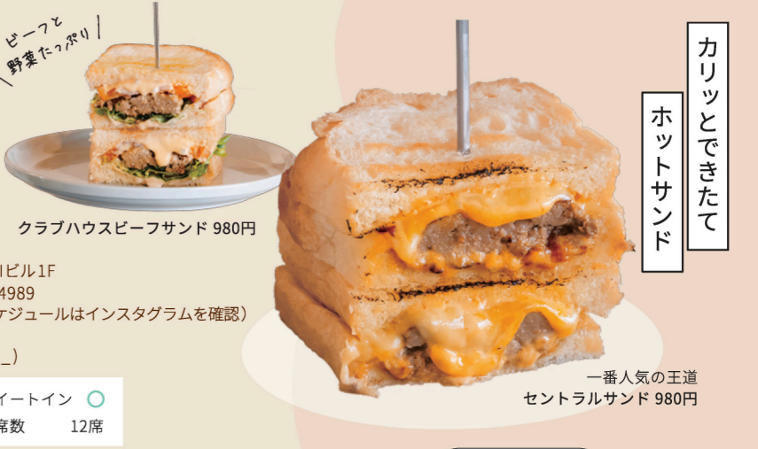
クラブハウスビーフサンド 980円