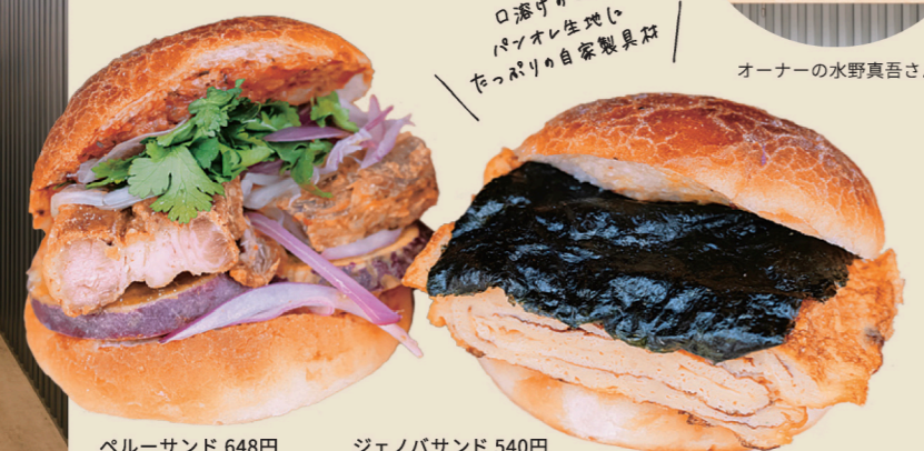
ペルーサンド 648円 ジェノバサンド 540円