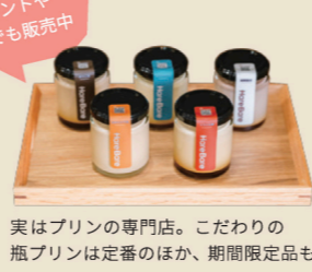
実はプリン専門店。こだわりの瓶プリンは定番のほか、期間限定品も登場する