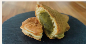
玉露入り緑茶たい焼(220円)

香ばしいきな粉あんがたっぷり詰まった「きなこ」、お口の中で紅茶の味が広がる「ミルクティー」、玉露ならではの芳醇な香りと豊かな余韻が楽しめる「玉露入り緑茶」の3種のあんこのたい焼が新登場。いずれもあんこの風味と香りが楽しめるたい焼に仕上がっています。