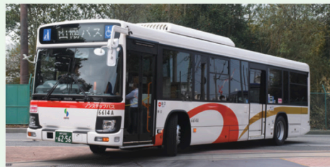
レッツ号復刻塗装バス

間/山陽バス 企画部 078-782-6068 (8:45~17:30 土・日・祝は除く) ※個別の車両運用に関するお問い合わせはご遠慮ください