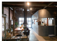
食品卸会社の倉庫をリフォームしたモダン空間

平日はデザイン事務所を営み週末は農業に勤しむ、地域の農家とのつながりも強いオーナーが2024年に立ち上げたスペース。月～水曜は野菜たっぷりの週替わり定食、金・土曜はカレーか3種のサンドイッチから選べる。スパイスが引き出す新鮮野菜の多彩なおいしさが堪能できる。