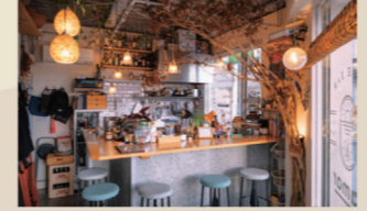
カフェ & バーの洗練された空間