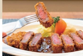
ビーフカツレツ(2,200円) ※4月14日(火)現在の価格です

お城を眺めながらの散策や友達とのランチなど、思い思いの過ごし方ができる街です。私のお気に入り、買った古本を持ち寄って、カフェでのんびり過ごす時間。帰りの電車に乗る前には、山陽百貨店に少し寄り道するのもお約束です。