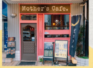
国道2号沿い、街角に映えるピンクの壁が目印

📖 テイクアウト ○ 🍴 イートイン ○ 📖 キッズメニュー × 🍴 席数 27席