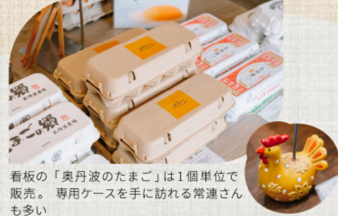
看板の「奥丹波のたまご」は1個単位で販売。専用ケースを手に訪れる常連さんも多い