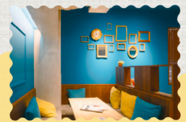
青に包まれたモダンな空間

📖 テイクアウト ○ 🍴 イートイン ○ 📖 キッズメニュー × 🍴 席数 37席