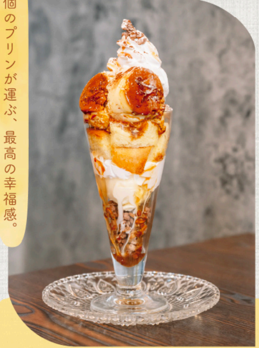
「贅沢プリンパフェ」(1,450円)