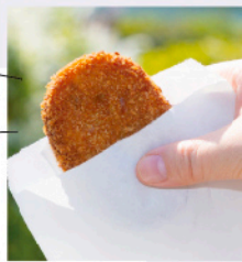
牛すじ肉の「コロッケ」(110円) ※6月から価格改定予定