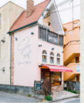
住宅街に佇む、ピンクの三角屋根が目印。山陽垂水駅近くの商店街には支店も構える