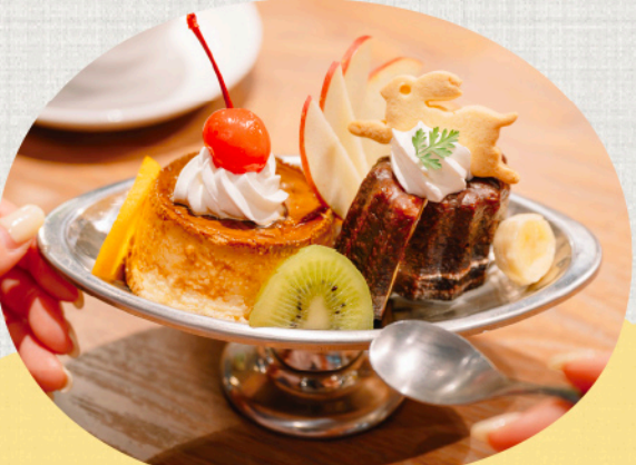
「魅惑のプリンアラモード」(1,188円)