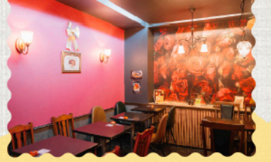
そこにいるだけで気分が上がる、ビッドで華やかな内装