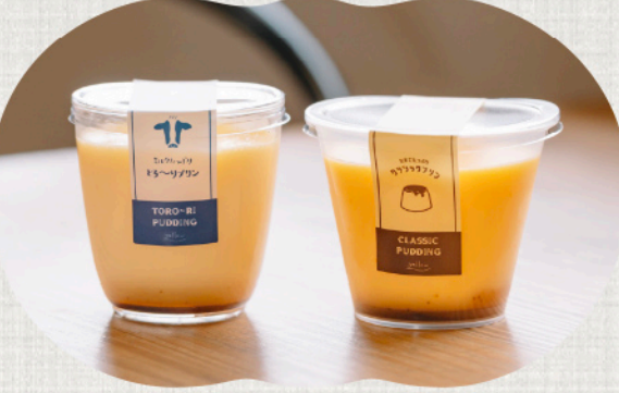
「とろ〜りプリン」「クラシックプリン」各280円