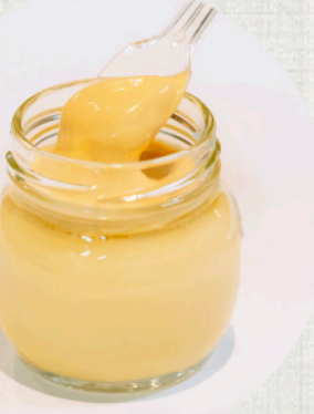
「きりんこぷりん」(500円) ムースとプリンが口中で一体となる、ほろ苦さを抑えた上品な味わい

障害者の就労を支援するNPOが手がける「KIRINCO」。「誰もが携われるように」と工夫されたレシピから生まれたのが「きりんこぷりん」(500円)。姫路のブランド卵「夢美人」を贅沢に使用し、保存料・着色料を使わず作り上げた。生クリームのクリーミーな層に、ふんわりしたムースが重なりトロリと溶ける。