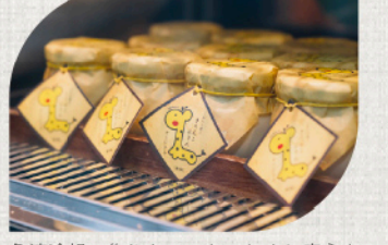
急速冷却で作ったのでおいしさや安心を閉じ込める。無添加ながら冷蔵で20日間持ちため、贈り物にも喜ばれる

📖 テイクアウト ○ 🍴 イートイン ○ 📖 キッズメニュー × 🍴 席数(共有スペース 20席)