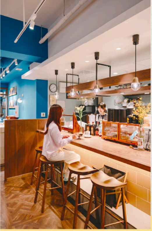
5席のカウンターやコンセント完備の席など、幅広い年代の人が思い思いに通わせる