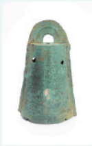
銅鐸(望塚出土 兵庫県立考古博物館蔵・県指定)

現在兵庫県では、縄文時代の遺跡が約700か所、弥生時代の遺跡が約2,200か所発見されている。これまでの調査で、それぞれの時代の人々がどのようなくらしを送っていたか、次第に明らかとなってきた。本展では、県内資料を中心に、縄文時代と弥生時代の遺物を比較し、その共通点や違いを探る。