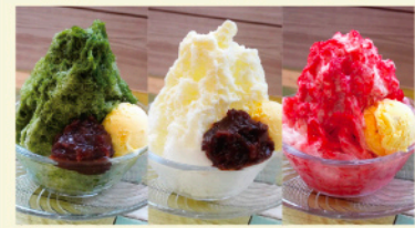
宇治金時 みらくる金時 いちごミルク

今年はすでに“あつつい季節”が到来しています。そこで珈琲駅サンロードでは、名物かき氷をさっそく販売します。定番の宇治金時、みらくる金時、いちごミルクに加え、新作かき氷もご用意しています。涼しい一杯をお楽しみください。