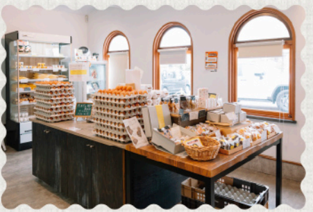
兵庫県産フルーツや野菜などを使ったジェラートに焼菓子、さまざまな卵製品が並ぶ店内

1921年の創業以来「循環型農業」を追求してきた株式会社龍谷。自社養鶏場「たまごの郷 奥丹波農場」で、よもぎや海藻などこだわりの飼料を食べて健やかに育った鶏が産む卵は、旨みとコクが際立つ。その味を堪能してほしいと、2019年にたまごとジェラートのお店「yellow」をオープン。プリンには2種類あり、丹波乳業のノンホモ低温殺菌牛乳を使い、卵本来の力強い風味を閉じ込めた「クラシックプリン」(280円)はしっかりした食感。対照的に「とろ〜りプリン」(280円)はなめらかな口溶け。カフェには「プリンセット」(750円)やモーニングメニューもあり。