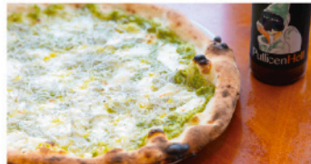
「タルミーナ」(2,000円)は垂水漁港のしらすとズッキーニペーストが主役。レモンオイルが爽やか