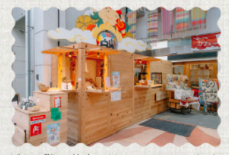
ビル1階の共有フリースペースでイートインも可能。プリンは数に限りがあるため、インスタグラムからの予約が確実