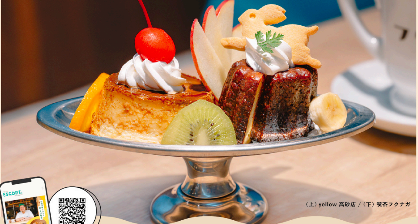
(上) yellow 高砂店 / (下) 喫茶フクナガ