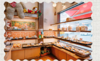
創業時から「子どもの思い出に残るパン」がコンセプト。地域に愛され続けている