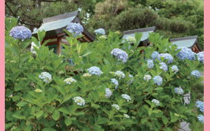
住吉神社の紫陽花