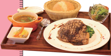
ランチ 桃色吐息のエシャロットソース (1,500円)