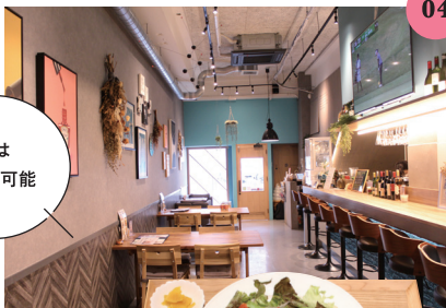
ステーキランチ 130g (1,250円)

姫路市忍町12ミストラル101 ☎0792-87-6529、11:30~23:30 (L.O.23:15)、火曜定休 ◆「山陽姫路駅」から徒歩約2分