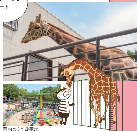
園内のミニ遊園地

姫路市本町68 姫路城東側 入園料/大人210円、小人30円(5歳未満は無料) ☎079-284-3636、9:00~17:00 (入園は~16:30) ◆「山陽姫路駅」から徒歩約15分