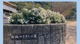
大塚のじぎくの里公園