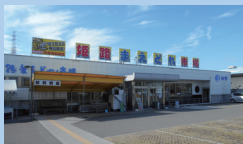
姫路まえどれ市場