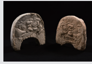
高田駅家(上郡町)・賀古駅家(加古川市)出土 瓦瓦

約1,300年前の古代山陽道沿いには、馬の乗り継ぎ拠点である「駅家」が整備されていた。兵庫県立考古博物館が開館以来継続している播磨の駅家に関する最新の調査成果をもとに、古代交通の実態を紹介する。