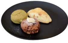
(左)抹茶とホワイトチョコ(300円) (手前)ロッキーロード(300円) (右)生姜スコーン(320円)