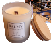
香りの良いキャンドル

姫路市網干区新在家569 11:00~16:00、水・木曜定休 ☎079-255-2584 ◆「山陽網干駅」から徒歩約13分