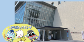
兵庫津ミュージアム