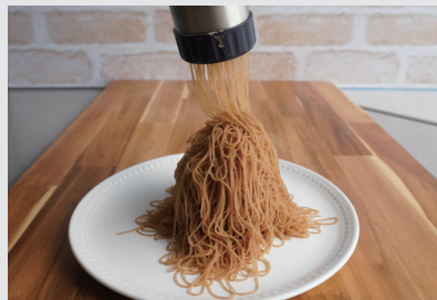
生搾りモンブラン