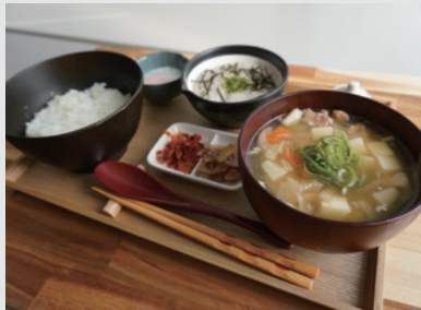
「たっぷりとろろとごちそう豚汁定食」1,100円

販売店／珈琲駅サンロード(「山陽明石駅」徒歩すぐ) 販売時間／11:00~L.O.20:30(日・祝~L.O.19:30)