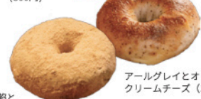
きなここし餡とクリームチーズ (400円) ※4月14日(火)現在の価格です