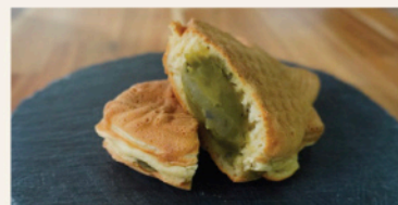
玉露入り緑茶たい焼(220円)

香ばしいきな粉あんがたっぷり詰まった“きなこ”、お口の中で紅茶の味が広がる“ミルクティー”、玉露ならではの芳醇な香りと豊かな余韻が楽しめる“玉露入り緑茶”の3種のあんこのたい焼が新登場。いずれもあんこの風味と香りが楽しめるたい焼に仕上がっています。