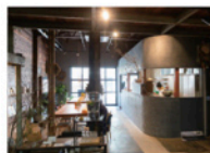
食品卸会社の倉庫をリフォームしたモダン空間

平日はデザイン事務所を営み週末は農業に勤しむ、地域の農家とのつながりも強いオーナーが2024年に立ち上げたスペース。月～水曜は野菜たっぷりの週替わり定食、金・土曜はカレーか3種のサンドイッチから選べる。スパイスが引き出す新鮮野菜の多彩なおいしさが堪能できる。