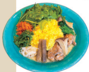
野菜ゴロゴロおとなの甘辛グリーンカレー (1,320円)

姫路市忍町106 ① 11:30-14:30 (ランチ L.O.13:30) ※売り切れ次第終了 (ドリンク L.O.14:00) ※テイクアウトドリンクのみ 10:00～14:00 ② 木曜、日曜 ☎ 問い合わせ・営業時間などについては Instagramから 📍「山陽姫路駅」徒歩約5分 Instagram@hitsujiugumo106