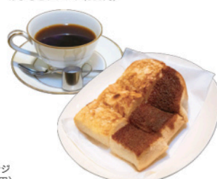
アーモンドとシナモンのハーフ&ハーフトースト(550円)

姫路市二階町49(みゆき通り商店街内) ① 7:00～17:00 ② 木曜 ☎ 079-282-2233 📍「山陽姫路駅」徒歩約8分 Instagram@hamamoto_coffee