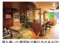
落ち着いた雰囲気と実行のある店内

姫路市二階町49(みゆき通り商店街内) ① 7:00～17:00 ② 木曜 ☎ 079-282-2233 📍「山陽姫路駅」徒歩約8分 Instagram@hamamoto_coffee