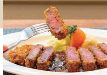
ビーフカツレツ(2,200円) ※4月14日(火)現在の価格です

お城を眺めながらの散策や友達とのランチなど、思い思いの過ごし方ができる街です。私のお気に入り、買った吉本を持ち寄って、カフェでのんびり過ごす時間。帰りの電車に乗る前には、山陽百貨店に少し寄り道するのもおすすめです。